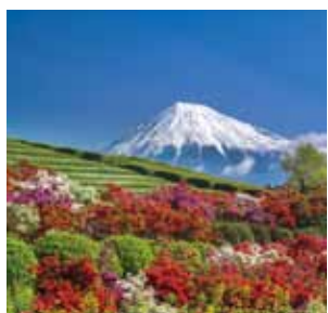
〈表紙写真〉 ツツジと富士山